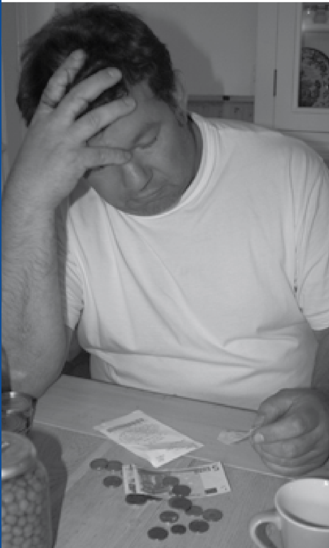
De bewindvoerder zorgt ervoor dat er geen schulden meer ontstaan

Er zijn ook professionele bewindvoerders. Die zijn soms duur en hebben vaak weinig tijd om met de cliënt te overleggen. Aan de andere kant hebben ze vaak wel een officiële klachtenprocedure en zijn ze beter te controleren dan bijvoorbeeld een familielid. Gelukkig zijn er ook stichtingen die zonder winst oogmerk werken en in de regel meer tijd hebben voor cliënten.