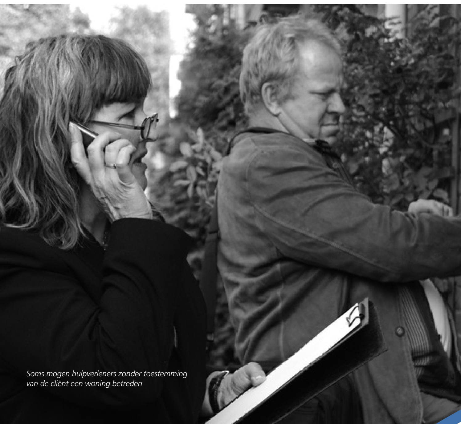
Soms mogen hulpverleners zonder toestemming van de cliënt een woning betreden