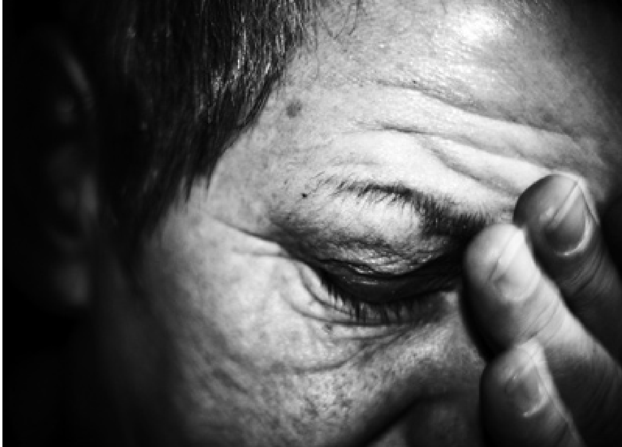
Cliënte ziet geen andere uitweg meer dan euthanasie