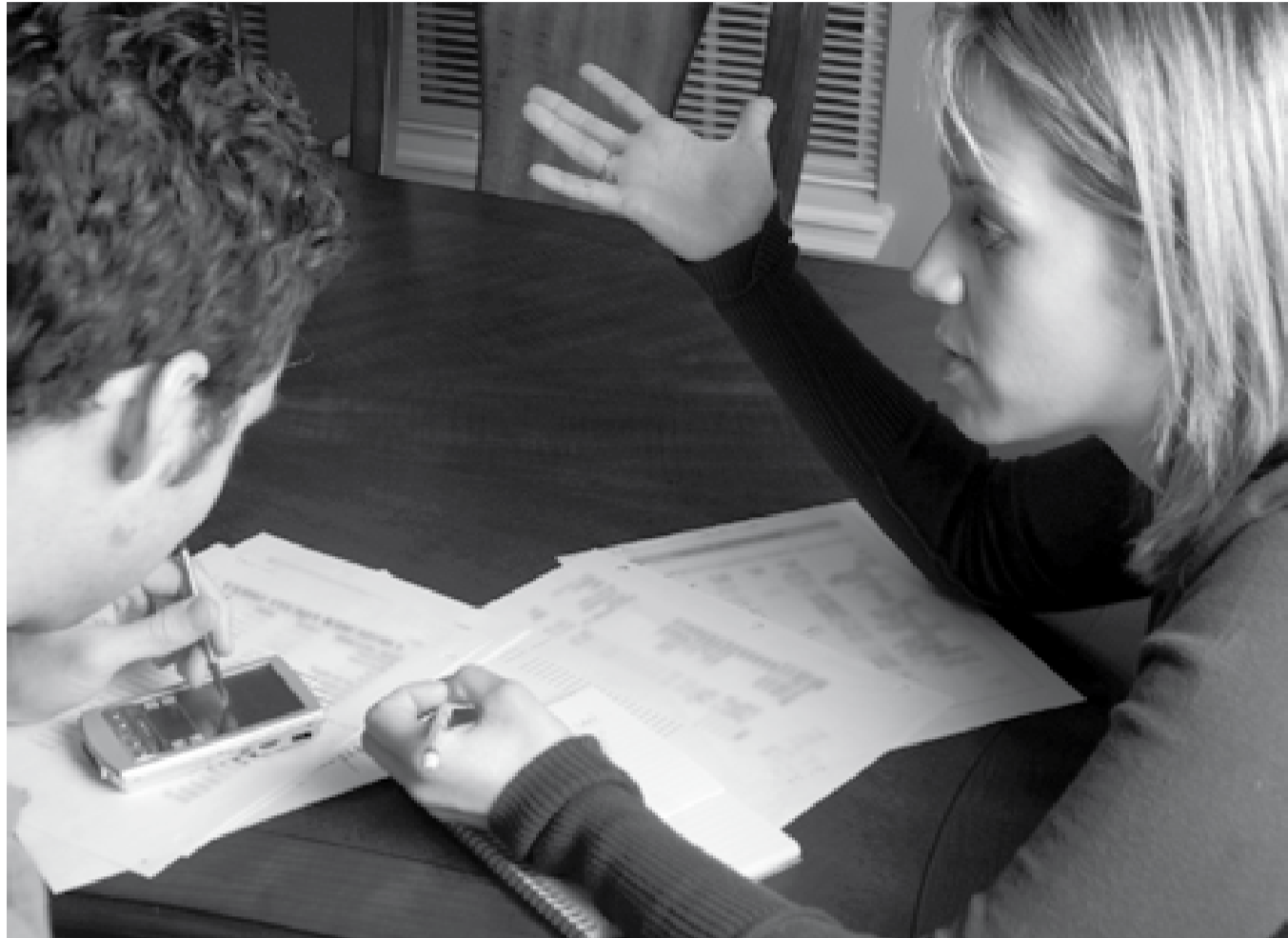
Een goede bewindvoerder betreft de cliënt bij beslissingen

ER: “Mede daarom is het belangrijk dat de ggz-instelling haar verantwoordelijkheid neemt om de cliënt te informeren dat er misschien geen zitting wordt gehouden en dat men daartegen bezwaar kan maken bij de rechtbank. Verder vind ik het heel belangrijk dat de instelling bij de aanvraag aan de rechtbank al aangeeft of de cliënt het er wel of niet mee eens is, zodat de rechtbank kan bekijken of er misschien toch een zitting gewijd moet worden aan die zaak.”